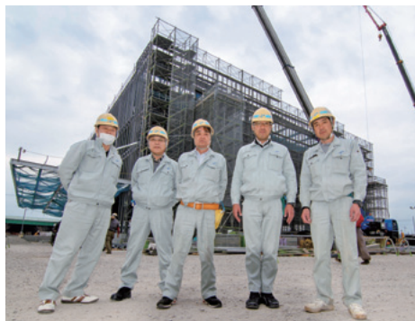
長田消防団第2分団の皆さん