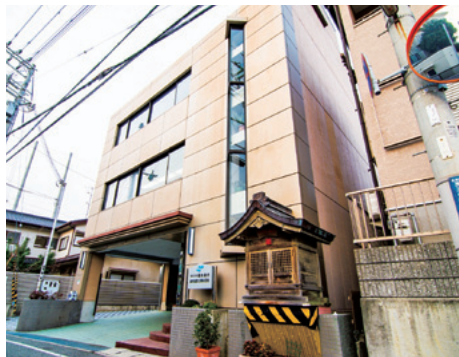
清水建設工業株式会社